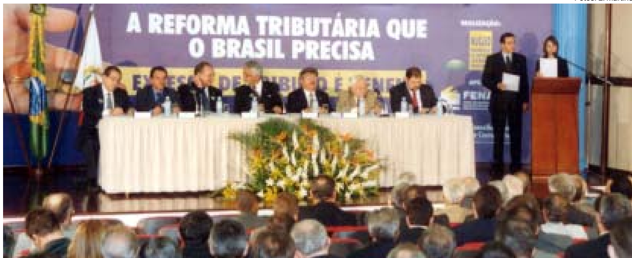
Representantes de diversos segmentos sociais, políticos e econômicos do País estiveram no Ato Público, realizado em Brasília (DF)

Cerca de 200 pessoas, entre empresários, contabilistas, parlamentares, representantes de entidades sindicais e de federações patronais, estiveram no Ato Público “A Reforma Tributária que o Brasil Precisa”, no último dia 19, na sede do CFC, em Brasília (DF). O evento foi realizado pelo Núcleo Parlamentar de Estudos Contábeis e Tributários, com o apoio do CFC e da Federação Nacional das Empresas de Serviços Contábeis e das Empresas de Assessoramento, Perícias, Informações e Pesquisas (Fenacon).