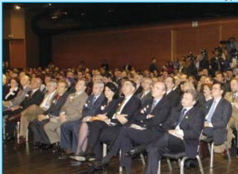
Mais de 800 empresários estiverem presentes ao evento que deu início às atividades da Associação de Apoio a Políticas de Segurança Alimentar - Apoio Fome Zero

O ponta-pé inicial já foi dado. No dia 8 de julho, a categoria contábil, por meio do Conselho Federal de Contabilidade (CFC), tornou-se uma grande aliada na luta pelo fim das desigualdades sociais no País. A data marcou o lançamento de uma iniciativa encabeçada pelo CFC e por alguns dos maiores empresários do Brasil, além de ter o apoio do Governo Federal: a Associação de Apoio a Políticas de Segurança Alimentar – Apoio Fome Zero. O Conselho é a pri-