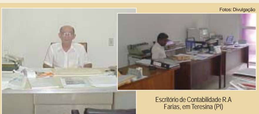
Escritório de Contabilidade R.A Farias, em Teresina (PI)

Em 1942, seus pais trocaram o sertão cearense pela capital piauiense. “Eu era ainda garoto quando comecei a estudar na escola Técnica Demóstenes Avelino, em Teresina, que hoje não existe mais. Sempre sonhei em trabalhar com números. Amo minha profissão com a mesma