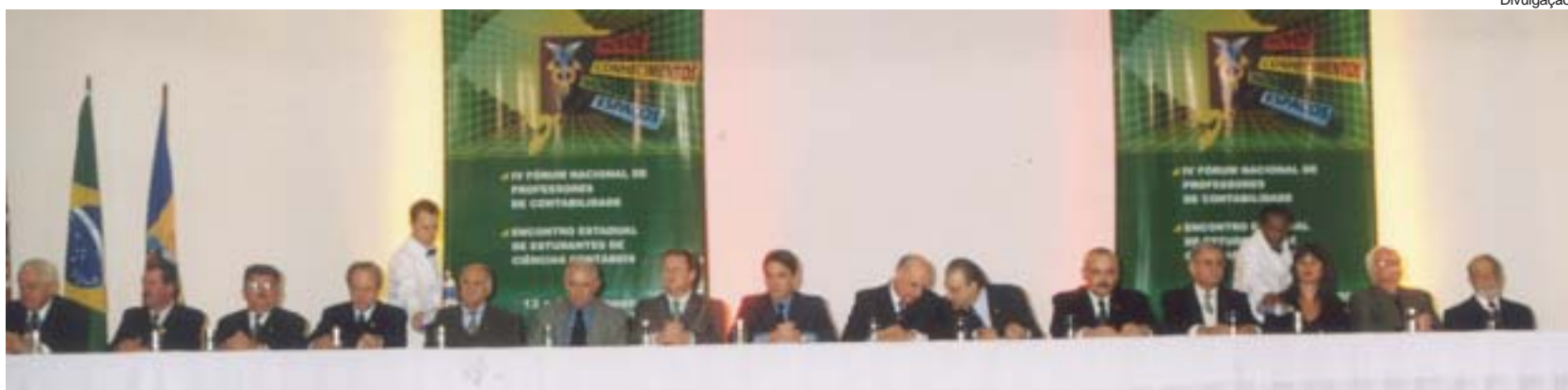
A abertura da IX Convenção e do IV Fórum contou com a presença do governador do Rio Grande do Sul, Germano Rigoto, e do chefe da casa civil do governo, contador Alberto Oliveira

A carência de professores, em Ciências Contábeis, que possuem cursos de mestrado, doutorado e pós-graduação foi uma das principais questões levantadas durante o IV Fórum Nacional de Professores. O evento foi realizado paralelamente à IX Convenção de Contabilidade do Rio Grande do Sul (RS), nos dias 13 a 15 de agosto, na cidade de Gramado (RS).