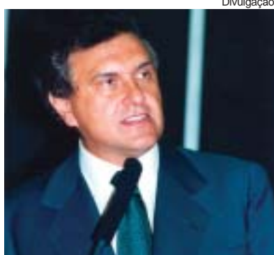
Relator Ronaldo Caiado

Para isso, o presidente da Comissão Especial, deputado Alexandre Cardoso (PSB-RJ), e o relator da matéria, deputado Ronaldo Caiado (PFL-GO), estão trabalhando nas lideranças para convencer os parlamentares sobre a necessidade de dar prosseguimento aos trabalhos de elaboração do projeto de lei da Reforma Política. Um dos pontos mais polêmicos levantados até então, e que tem despertado maior interesse do CFC, é o financiamento público de campanhas eleitorais.