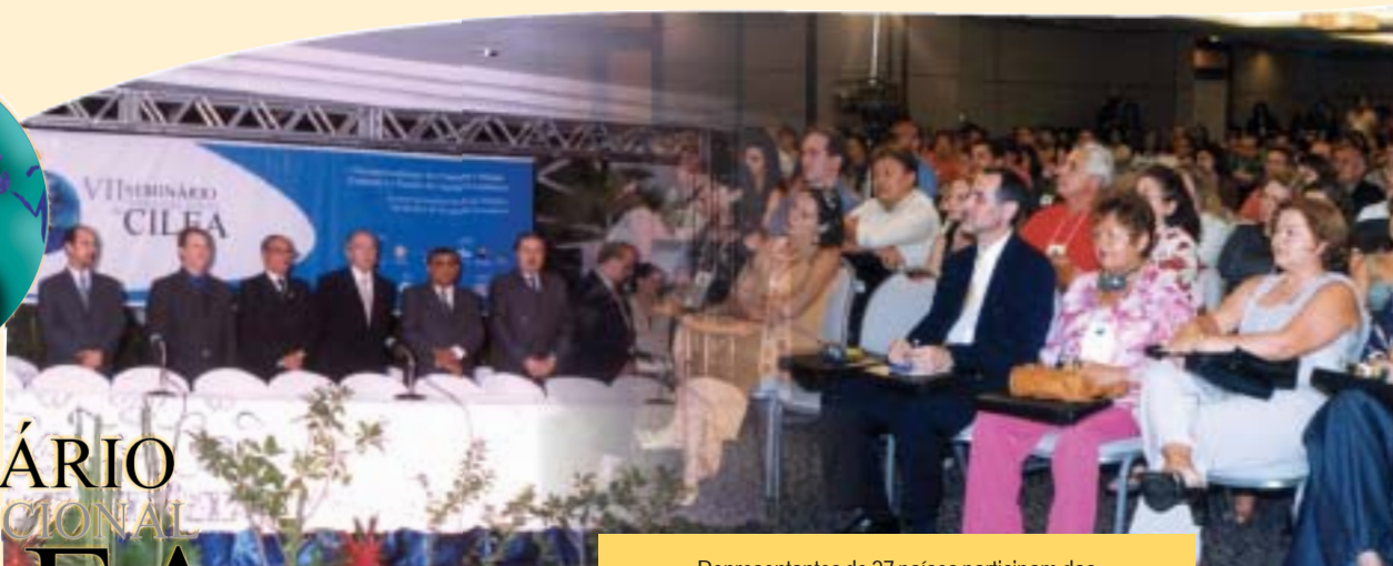
Representantes de 27 países participam das atividades do VII Seminário Internacional do CILEA

Os grandes eventos são medidos pelos resultados que eles apresentam na conclusão de suas atividades. Com o VII Seminário Internacional do CILEA (Comitê de Integração Latino Europa-América) não poderia ter sido diferente. Ao reunir um público de 340 inscritos, em Fortaleza (CE), e representantes de 27 países, a rica troca de conhecimentos e de informações a respeito do tema principal “A Internacionalização das Pequenas e Médias Empresas e o Desafio dos Agentes Econômicos” já era esperada.