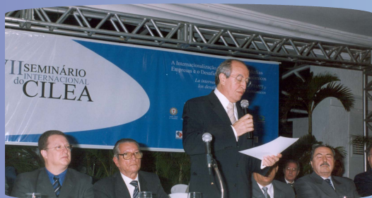
Solenidade de abertura com palestra magna proferida pelo governador do Ceará, Lúcio Gonçalves de Alcântara