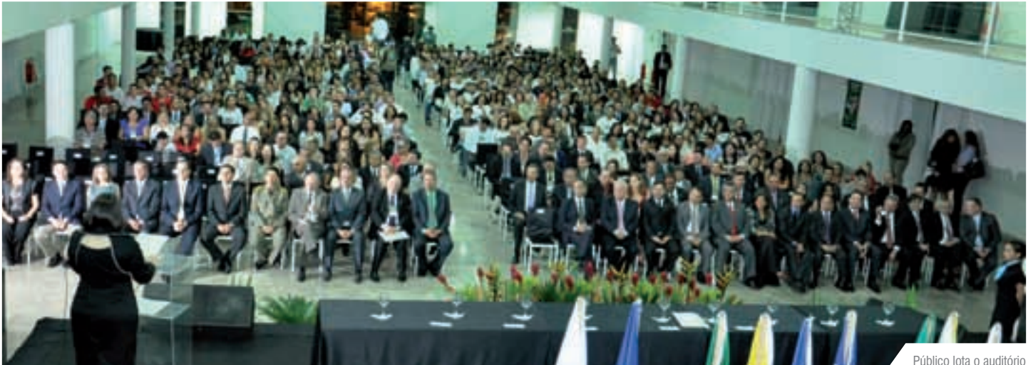
Público lota o auditório