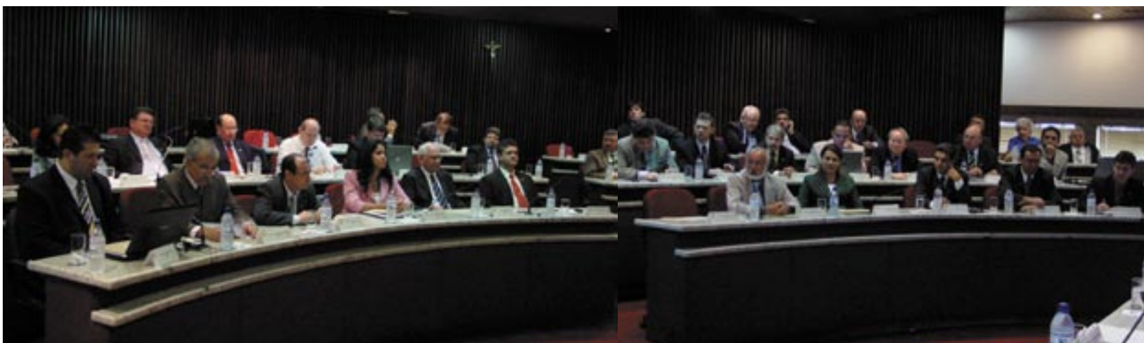
Plenário do CFC em Brasília/DF