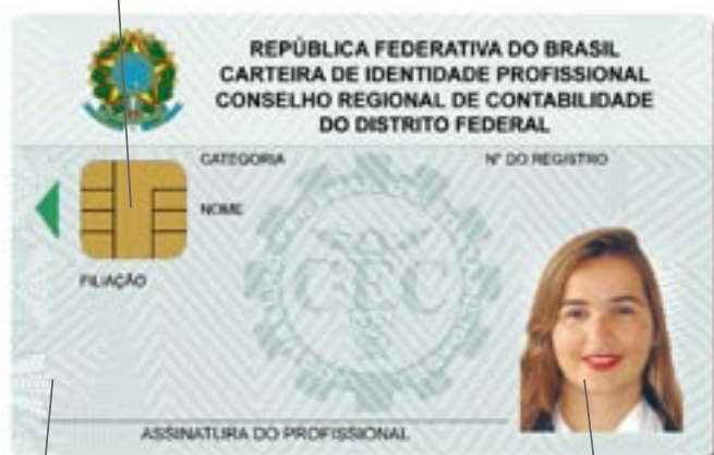
Imagem de fundo integrada

- Com certificação digital, o chip auxiliará no acesso aos serviços públicos essenciais credenciados