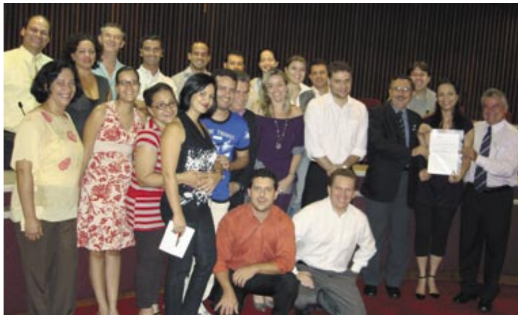
Facilitadores da Qualidade do CFC

A certificação permitirá ao CFC unificar linguagens e procedimentos de seus gestores, gerando maior qualidade, eficiência e eficácia nos trabalhos realizados em prol da classe contábil brasileira.