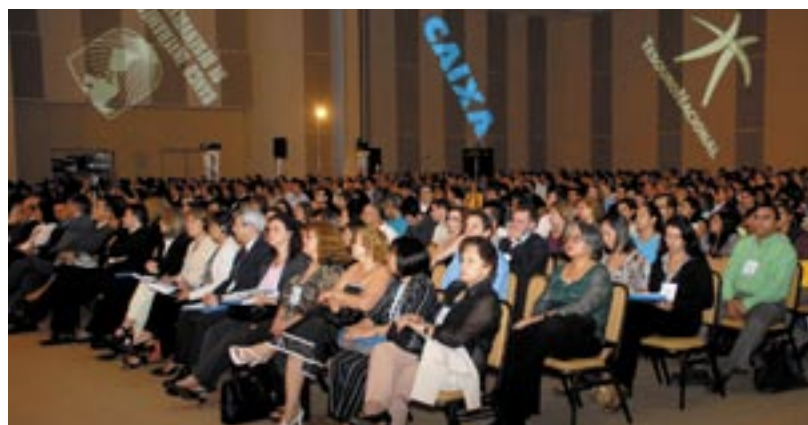
Participantes conheceram melhor os rumos da Contabilidade Pública no Brasil