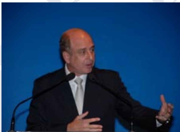
Benjamin Zymler, ministro do Tribunal de Contas da União

Em função dessa inovação, ele citou um acordo feito pelo TCU com a NAO, após a promulgação da Constituição, para a adaptação das atividades do Tribunal brasileiro na realização das auditorias de cunho operacional. “No Brasil e no Reino Unido, há legislações diferentes, mas a essência da função do TCU e da NAO é a mesma: o controle das contas públicas”, afirmou o ministro.