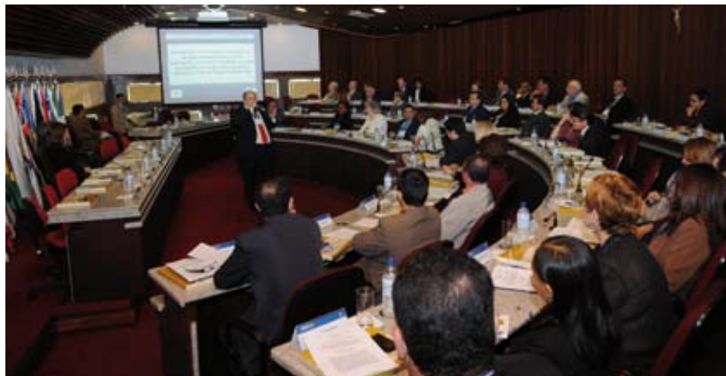
Os presidentes se reuniram no plenário do CFC

Durante o Seminário, os presidentes dos CRCs discutiram e traçaram as diretrizes estratégicas, dando continuidade ao trabalho iniciado no Seminário anterior, ocorrido nos dias 28 e 29 de fevereiro. Naquela ocasião, alguns pontos do Planejamento Estratégico do Sistema CFC/CRCs já haviam sido definidos, como a visão de futuro: “Ser referência nacional e internacional como órgão de profissão regulamentada, politicamente articulado e formador de opinião em questões socioeconômicas, tributá-