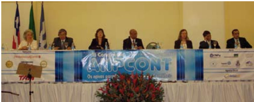
Mesa de honra da abertura do evento

O Congresso da Associação Nacional dos Programas de Pós-Graduação em Ciências Contábeis – Anpcont foi realizado no período de 15 e 16 de junho de 2008, em Salvador (BA), no Hotel Pestana Bahia. Representantes da comunidade acadêmica e do Sistema CFC/CRCs prestigiaram o evento, que tem como premissa proporcionar a interação entre comunidade acadêmica, pesquisadores, professores e estudantes, representando um meio de divulgação da produção técnico-científica na área das Ciências Contábeis.