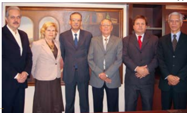
Membros da Comissão do CFC para estudos da Reforma Tributária