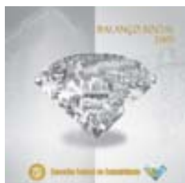
Capa do Balanço Social 2005

Outro projeto voltado às questões sociais foi lançado em novembro de 2008 e que também vem alcançando resultados positivos. Trata-se do Programa de Voluntariado da Classe Contábil , que tem como objetivo estimular a prática cidadã e o espírito de responsabilidade social entre os profissionais da Contabilidade.