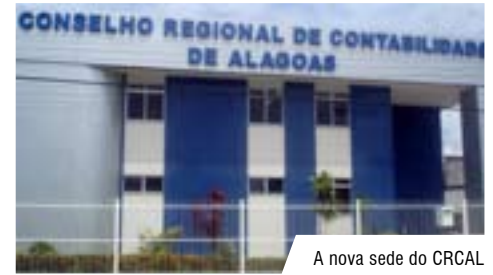
A nova sede do CRCAL