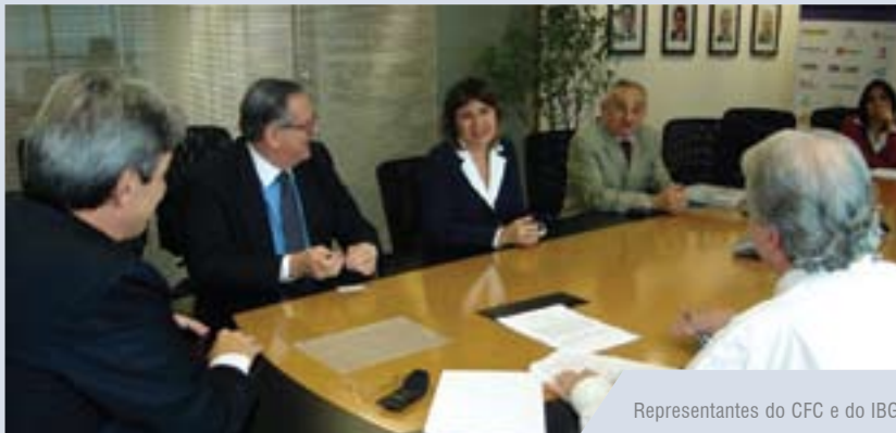
Representantes do CFC e do IBGC

A cooperação visa incentivar os profissionais do Sistema CFC/CRCs a aderirem ao Programa, valorizando a função de conselheiro fiscal e melhorando a qualidade das informações financeiras, assim como a realização de palestras e outros eventos relativos às atividades ligadas