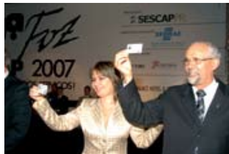
Lançamento da nova identidade profissional da profissão contábil

O novo documento de identidade do profissional contábil foi aprovado pelo Plenário do CFC em janeiro de 2007. O lançamento oficial da