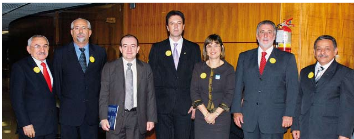
CFC, Sebrae e Fenacon reuniram-se com parlamentares, horas antes da aprovação do projeto

Desde que a proposta foi apresentada na Câmara dos Deputados, em 2007, o Conselho Federal de Contabilidade, em conjunto com os Conselhos Regionais (CRCs), a Fenacon e o Sebrae, entre outras entidades, vem trabalhando na sua aprovação, assim como tem desenvolvido ações que visam à disseminação de informações para os contabilistas sobre a importância do Simples Nacional para o desenvolvimento do País. A sanção presidencial está prevista, ainda, para dezembro, e a nova Lei entra em vigor em 1.º de janeiro de 2009.