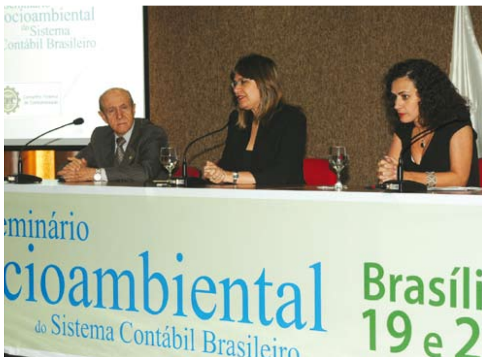
Solemnidade de abertura do I Seminário Socioambiental no auditório do CFC em Brasília (DF)