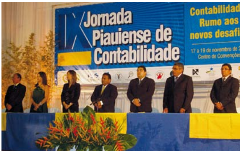
A presidente do CFC é homenageada com o título de Cidadã Teresinense

Por Fabrício Santos Colaborou Rosângela Bekman