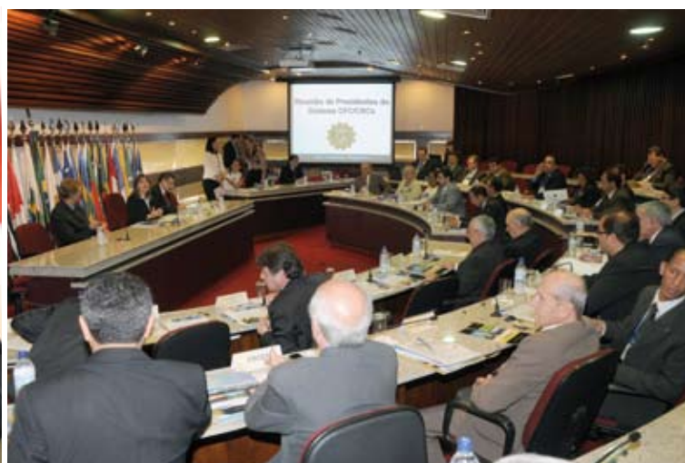
Plenário do CFC