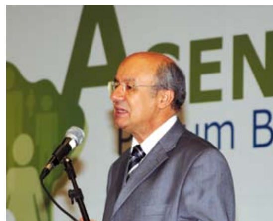
Ministro da Previdência Social, José Pimentel