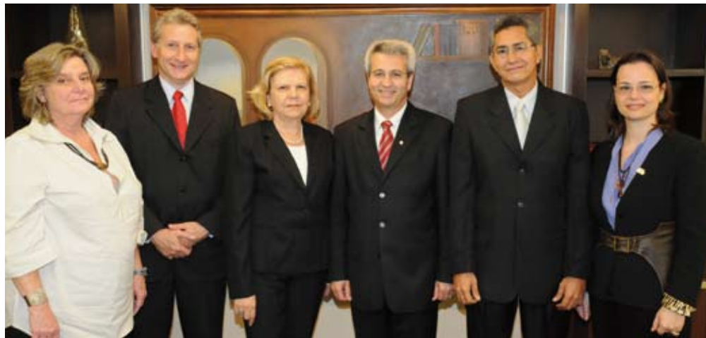
Comissão Gestora do Programa Voluntariado da Classe Contábil

Cada presidente do Conselho Regional designará uma Comissão