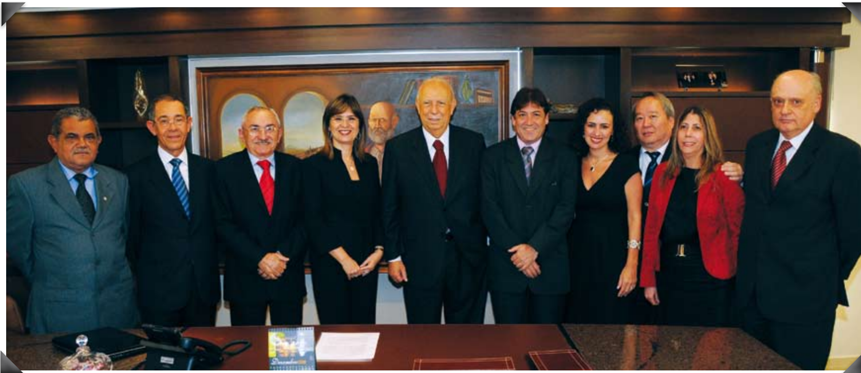
O Vice-presidente da República, José Alencar, com os membros do Conselho Diretor do CFC