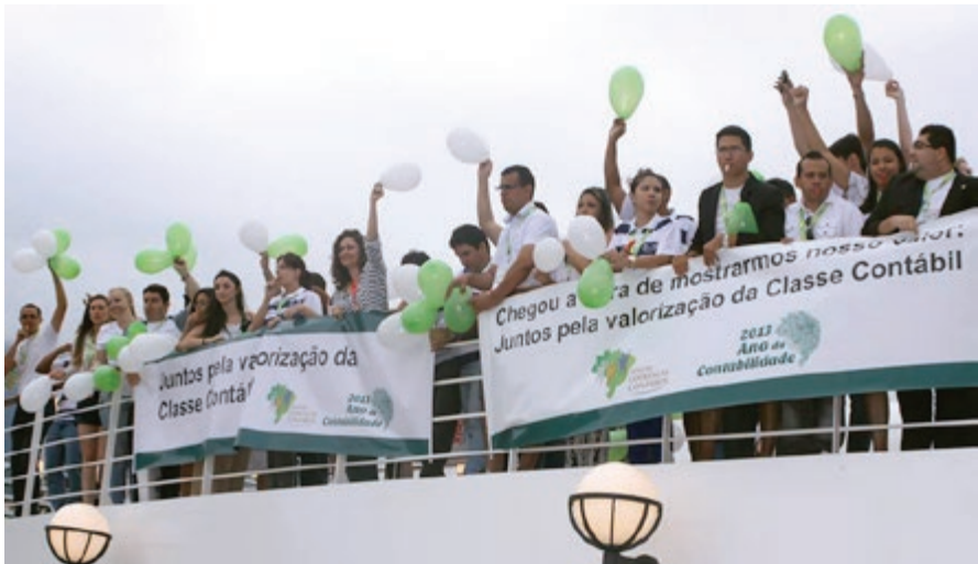
Participantes do 1º Encontro Nacional de Jovens Lideranças Contábeis, realizado em 2013.

“Só se chega a algum lugar quando se decide dar o primeiro passo.”