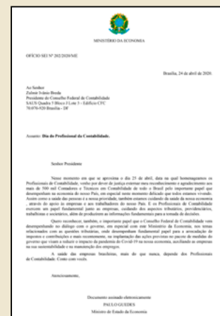
Paulo Guedes Ministro da Economia

DOCUMENTO >>> Ofício SEI n.º 202/2020/ME enviado ao CFC parabenizando a classe pelo dia 25 de Abril.