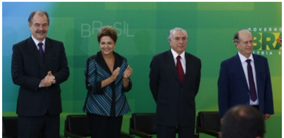
Da esquerda para a direita: ministro-chefe da Casa Civil, Aloizio Mercadante; a presidente Dilma Rousseff; o vice-presidente Michel Temer; e o ministro Renato Janine Ribeiro

instituições no exterior. O compromisso foi assumido pelo presidente do CFC com cerca de 800 profissionais e estudantes, durante o 5º Encontro Luso-Brasileiro de Contabilidade, realizado nos dias 20 e 21 de outubro do ano passado, em Campina Grande (PB).