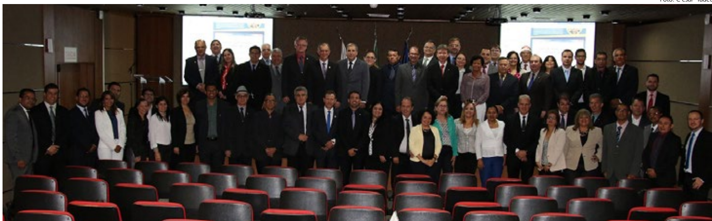
Participantes do Seminário no auditório do CFC

Por Fabrício Santos - Comunicação do CFC