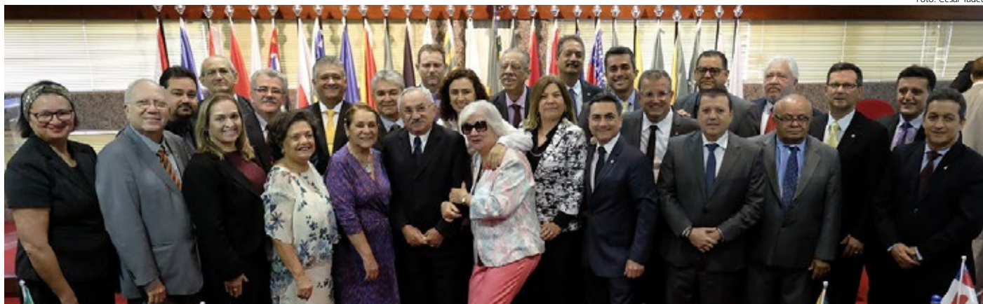
Presidentes dos CRCs no Plenário do CFC