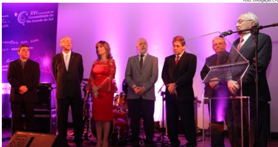
Representantes da classe contábil participaram de solenidade de lançamento