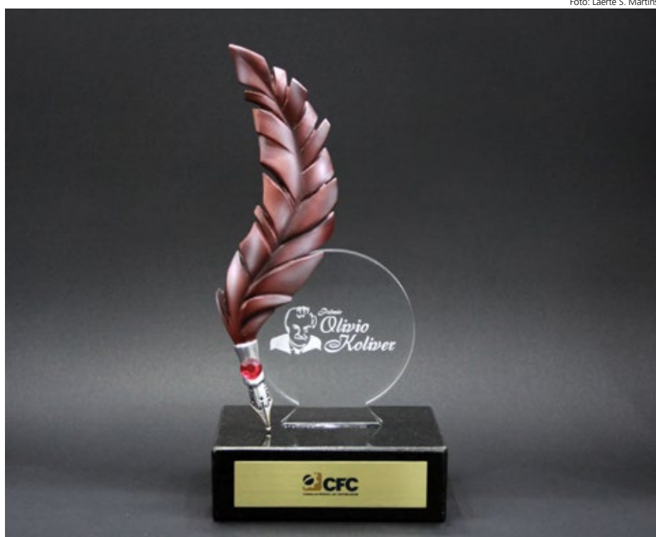
Troféu do Prêmio Olivio Koliver