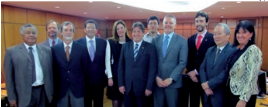
em São Paulo e