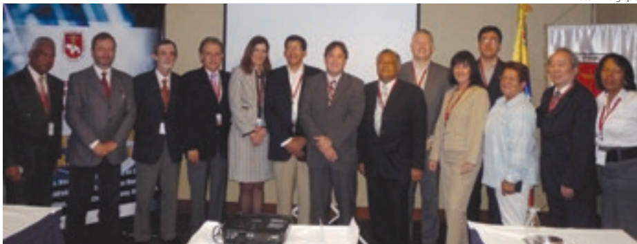
Reunião do diretório na Venezuela,