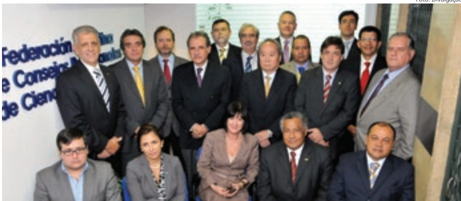
e em Buenos Aires